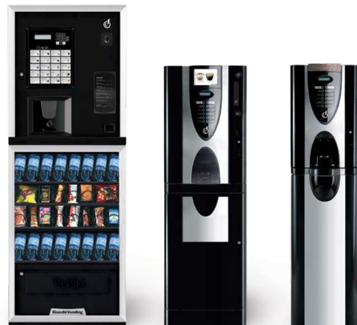
LEI300 SMART + ARIA S