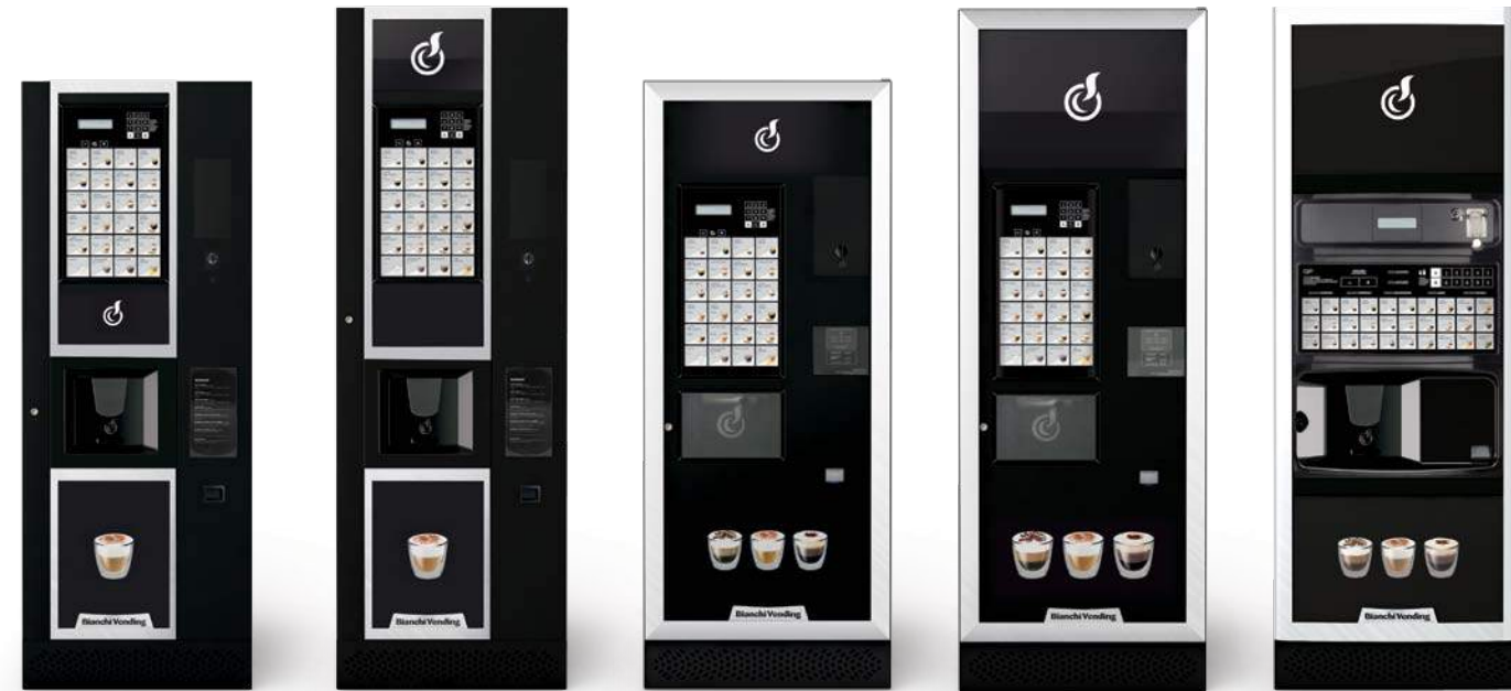
LEI400 EASY O SMART