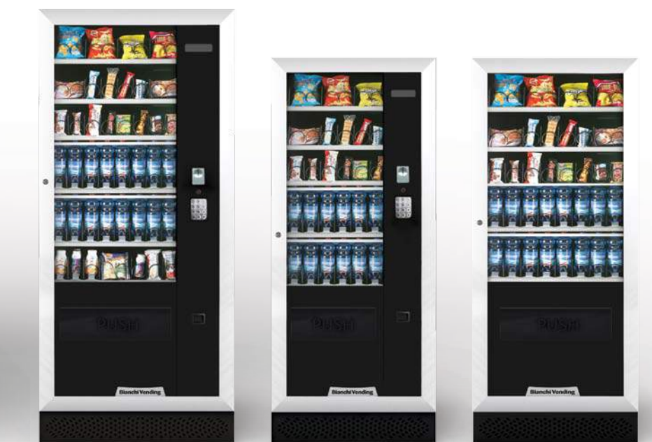
ARIA L MASTER