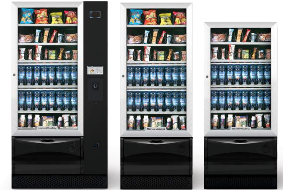
VISTA L MASTER TOUCH 7" LIFT