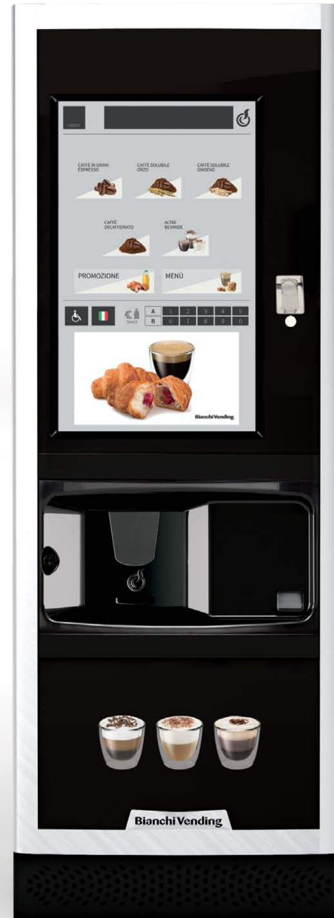
LEI700 PLUS 2 CUPS TOUCH 32"