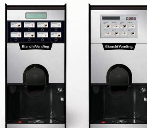
GAIA STYLE EASY